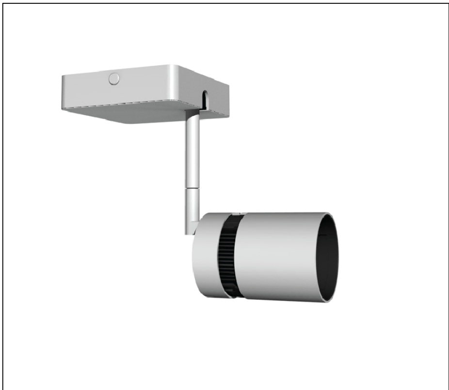
Render di apparecchio di illuminazione tipo: